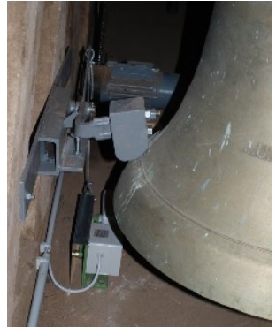
Der Hammer für den Stundenschlag